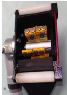
ニードルスケーラー